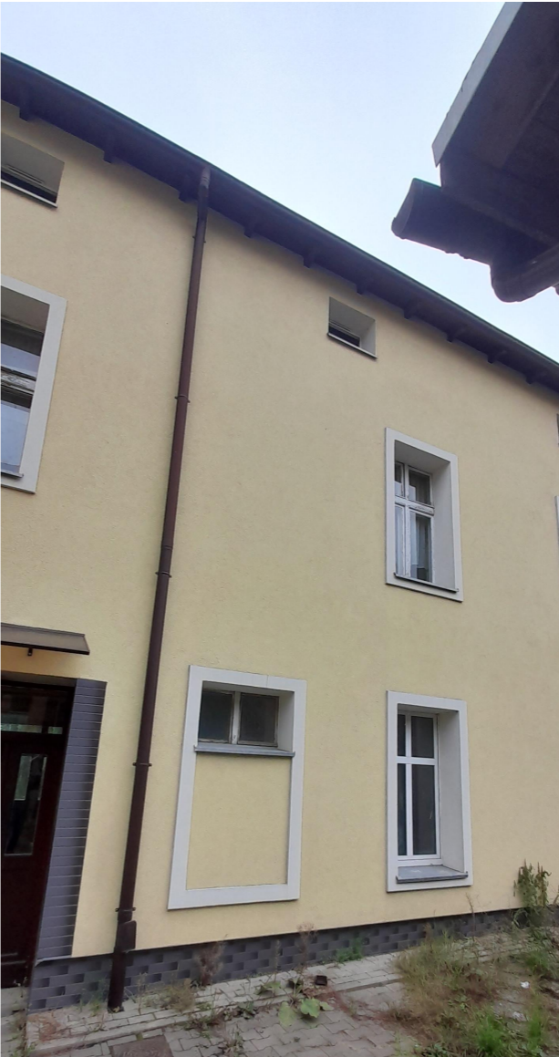
Fragment elewacji - stan istniejący

przewody kominowe prowadzone równoległe do połaci dachowej; należy zachować odległość min. 3m od okien w rzucie poziomym